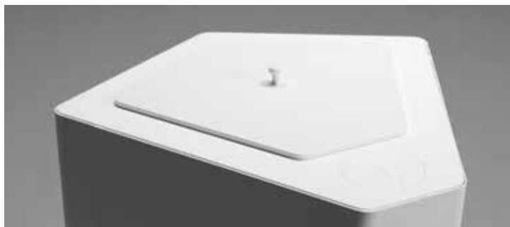
Kite lockinsats i lackerad MDF, NCS S 0500-N, vit.