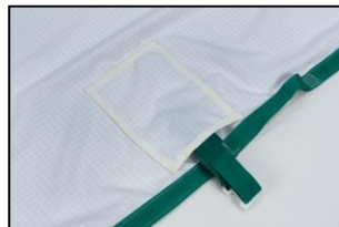
Spenner i lommer