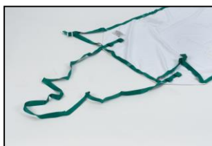
Ekstra lange stropper